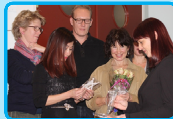
Stap op weg naar zelfstandigheid

kwetsbaarheid. De deelnemers weten nu wat het is om niet op te geven, om initiatieven te nemen, om het eigen leven te bepalen, om anderen te vertrouwen, om te zijn wie je kan/mag zijn.